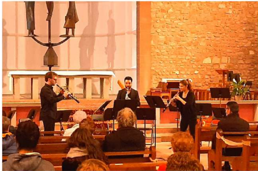
Le Congrès National du Hautbois

CETTE PÉRIODE COVID A RENDU LA VIE PARTICULIÈREMENT DIFFICILE AUX STRUCTURES CULTURELLES. NOTRE ÉTABLISSEMENT N'A PAS FAIT EXCEPTION. NÉANMOINS, QUELQUES MOMENTS MUSICAUX MAJEURS ONT ÉTÉ ORGANISÉS CETTE ANNÉE, RETOUR EN IMAGES.