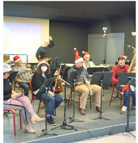
Enregistrement du concert de Noël