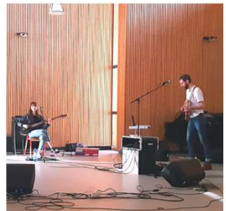
Résidence du trio COURBE