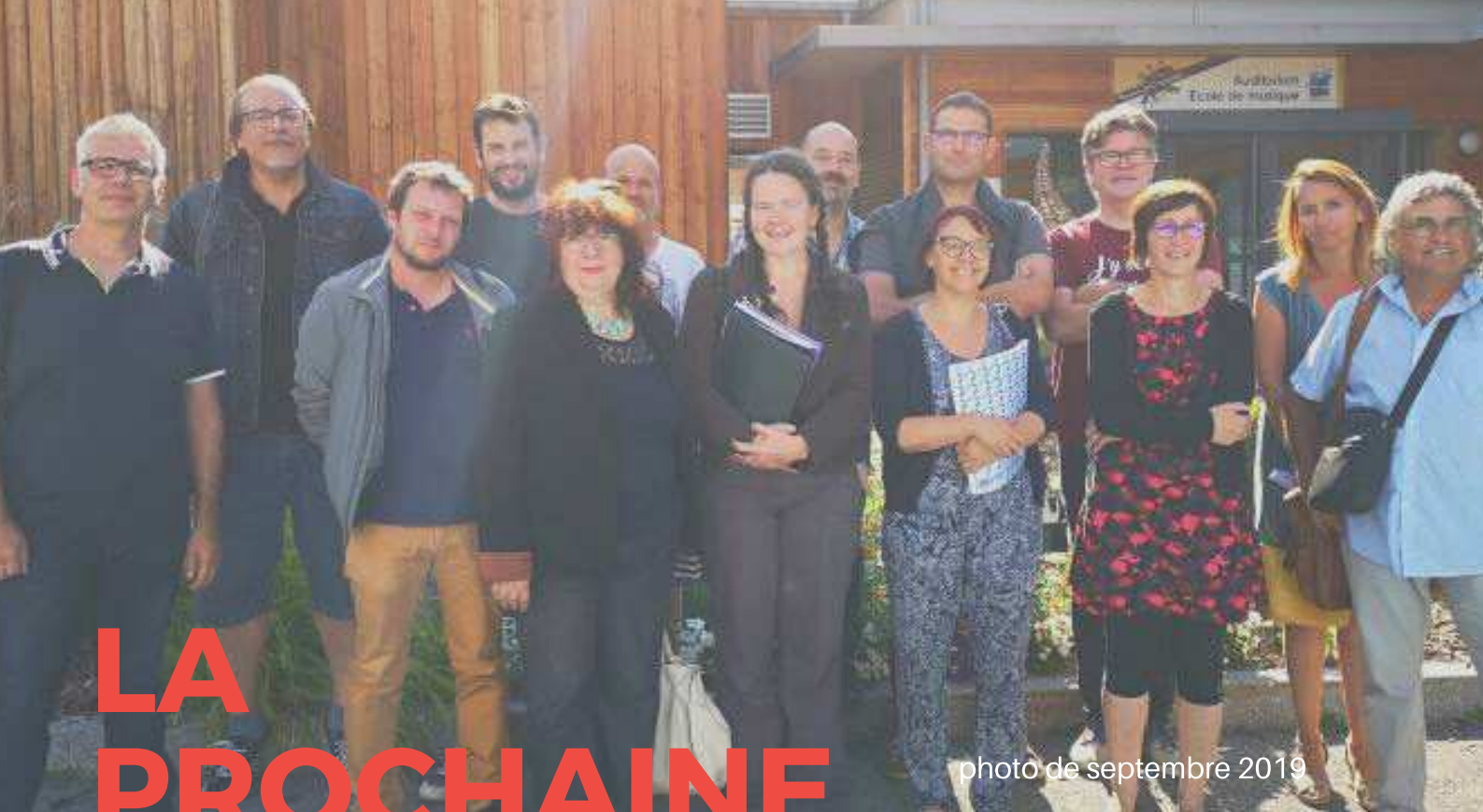
photo de septembre 2019